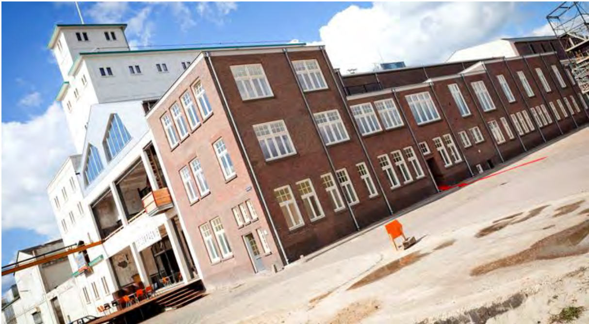
De 'Wiebenga Silo', onderdeel van CHV Noordkade, Veghel, Meierijstad

Dit plan sluit aan bij een ontwikkeling die door de instellingen in de Cultuurfabriek samen is opgepakt in een viertal programmaliijnen waarbij er één juist dat 'maken' centraal stelt. In een Fabriek wordt tenslotte iets gemaakt. Vanaf 2019 wordt vanuit Cultuurfabriek naar mogelijke externe financiering gezocht.